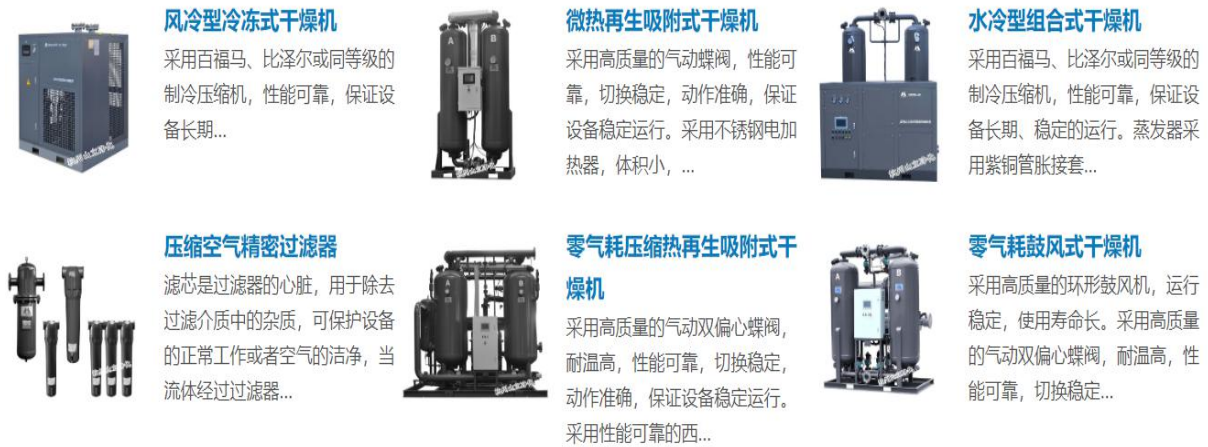
图表 3 公司产品种类及用途

公司致力于管理和创新工作，先后通过质量（ISO9001）、环境（ISO14001）、职业健康安全（OHSAS18001）体系认证。公司 2019 年导入卓越绩效管理模式。同时，公司建立了浙江省山立净化设备研究院，通过引进业内优秀的人才，形成一支高素质的研发团队，并与合肥机电研究所等高校、研究所合作进行新产品新技术的研究，整体技术水平业内领先。