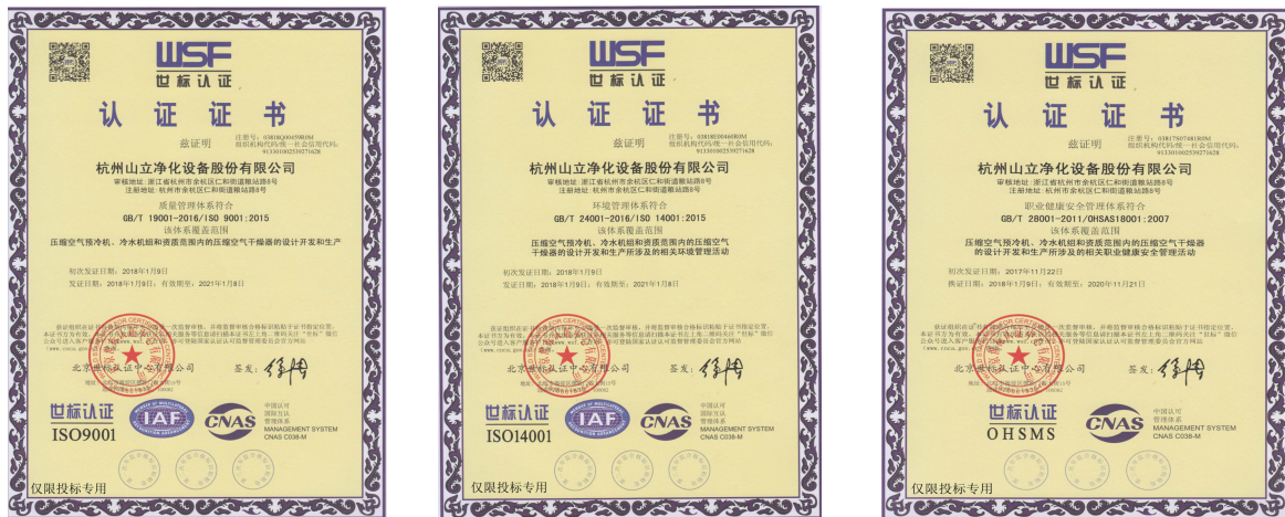
图表 4 体系认证证书

山立于 2019 年导入“浙江制造”模式进行管理，结合质量、环境、职业健康安全、卓越绩效管理模式、质量诚信标准要求建立了综合型管理体系。