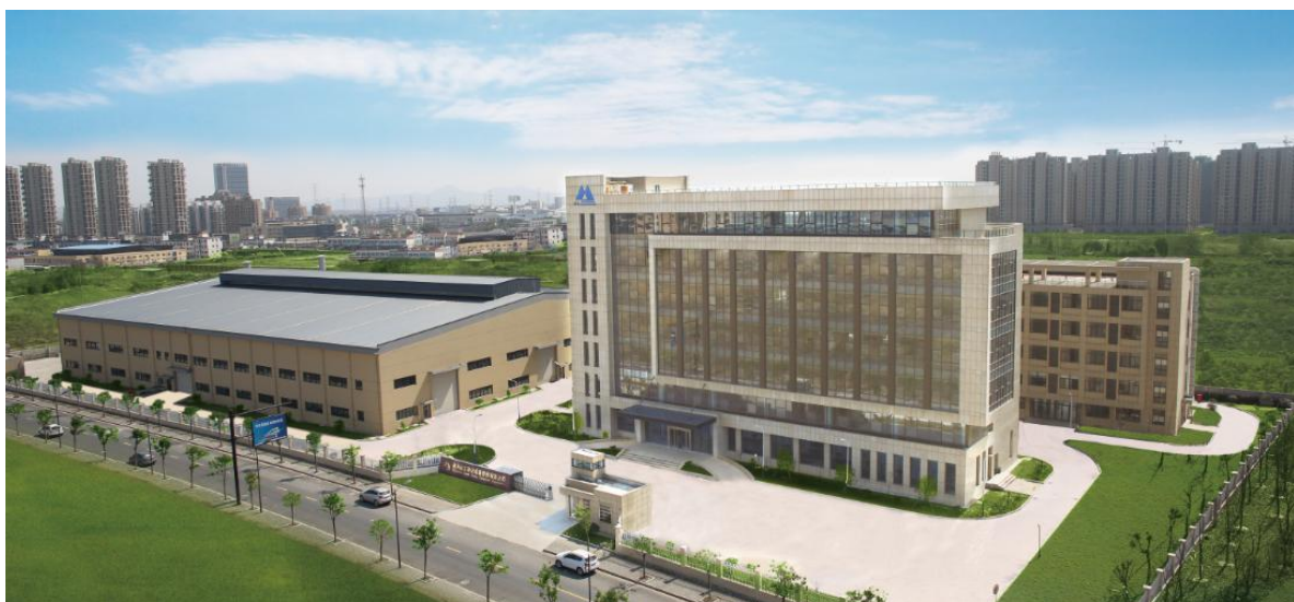
图表 1 公司总部厂区图

公司是中国压缩空气净化设备行业协会成员单位、国家高新技术企业、浙江省省级研究院，至今拥有有效专利数十项。建有现代化厂房，通过引进国际先进技术和现代企业管理模式，近年来公司整体得到了快速、稳步的发展，年销售额连续13年过亿，也已成为压缩空气净化设备专业制造商之一。